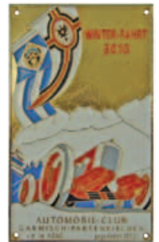
handbemalte Plaketten aus vergoldetem Metallguß