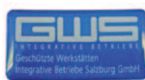
3D-Kleber Indoor & Outdoor