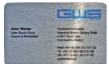
bedruckte Alu-Visitenkarte im Scheckkartenformat