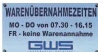
auf Rückseite gelaserte und eingemalte Spiegeltafel 123 x 57 cm