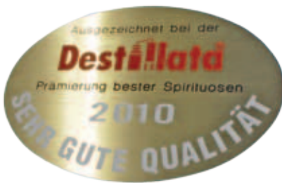
graviertes Messing eingemalt