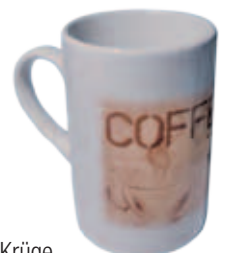
Tassen, Krüge, mit geschirrspülerfestem Dekor